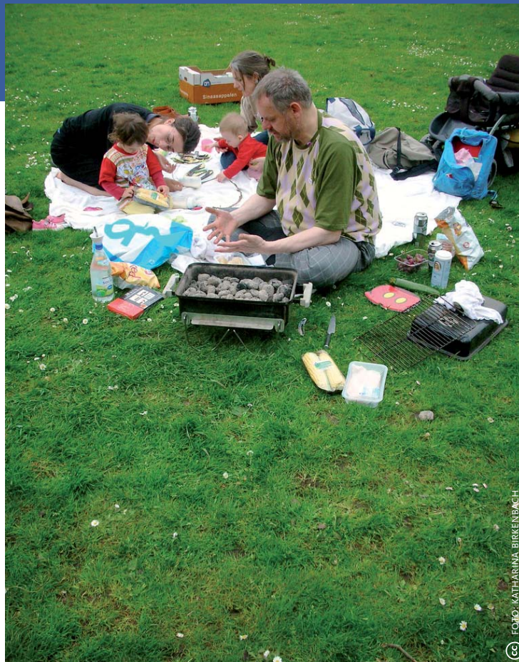
Hogeropgeleide Amsterdammers met kinderen gebruiken het Oosterpark als achtertuin om te barbecuen – hier op de speelweide.

Stadsbewoners kijken graag en worden graag